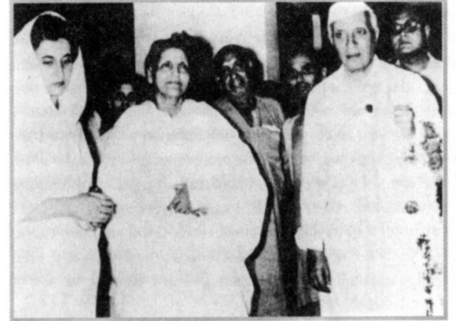
પંડિત નેહરૂ, ઈન્દીરા સાથે માં