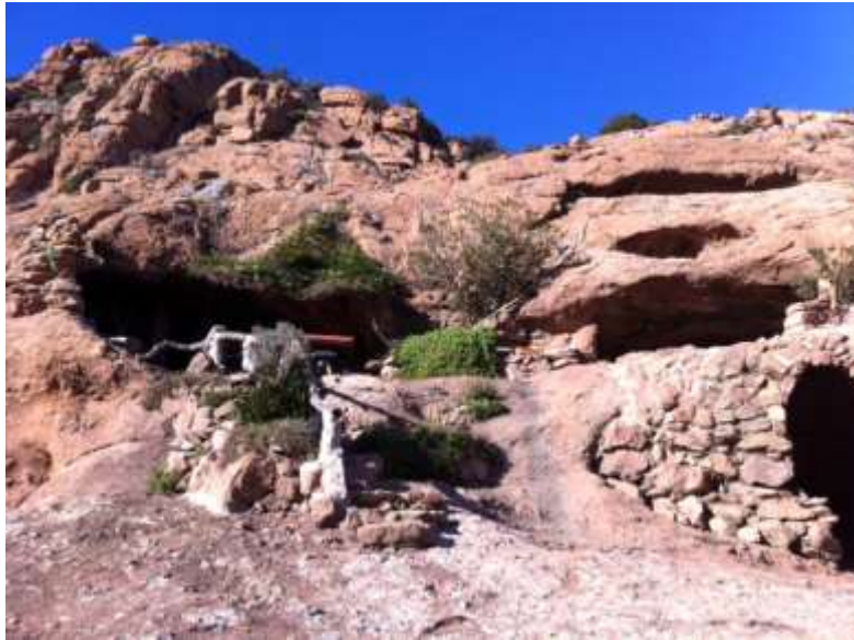
L'entrée de la grotte de Frère Antoine à Roquebrune sur Argens

émission de télévision célèbre l'avait montré, il y a quelques années, comme une sorte de phénomène original aux yeux ébahis des téléspectateurs !!! La 'montée' à la grotte, en crapahutant au milieu des sentiers sauvages parsemés de grosses pierres glissantes, bordés d'arbres de la Provence sous un ciel bleu garanti, vaut toujours son pesant d'or !!!