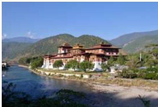
Le Dzong de PUNAKHA

En route pour PUNAKHA , nous nous arrêtons au col de DOCHULA (3050 m.), où la Reine-Mère Ashi Dorje Wangmo a fait élever en 2003 108 chorten blancs et rouges pour commémorer la victoire bhoutanaise sur l'U.L.F.A., front de libération de l'Assam. Nous pouvons admirer le panorama grandiose de la chaîne enneigée de l'Himalaya avec, d'ouest en est, les pics du Masagang (7200 m.), du Terigang (7060 m.) et du Gangkar Puensum (7541 m.), le plus haut sommet du Bhoutan. Les pentes boisées de feuillus, rhododendrons, pins Chir et cerisiers sauvages ( prunus cerasoides ) à la délicate floraison rose, offrent un paysage magnifique tout au long de la route en construction, où travailleurs népalais et bengalis en famille s'efforcent dans des conditions périlleuses. Cette Lateral Road , qui n'est pour le moment en beaucoup d'endroits qu'une piste et qui traverse tout le pays, devrait être terminée en 2018.